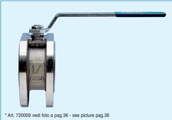
* Art. 720009 vedi foto a pag.36 - see picture pag.36